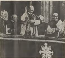
Aki riba e Papa nobo ta rondoná door di funcionarionan di e Vaticano, y ta durando su bendicion na un multitud den e Plaza di San Pedro.

Ta Cardinal Montini desde su cargo di pro-secretario pa e-un-